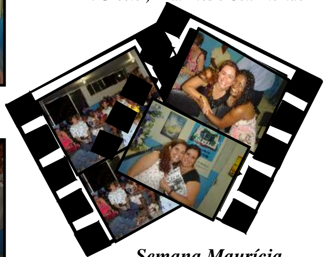
Semana Maurícia de 17 a 25 de setembro de 2006