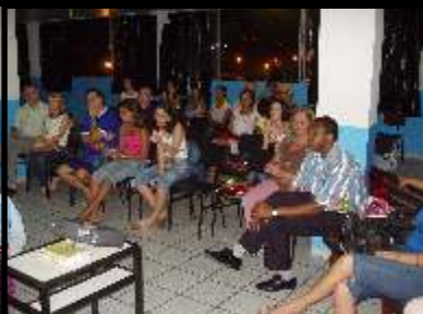
Parabéns aos trabalhadores da casa! Estiveram firmes e fortes.