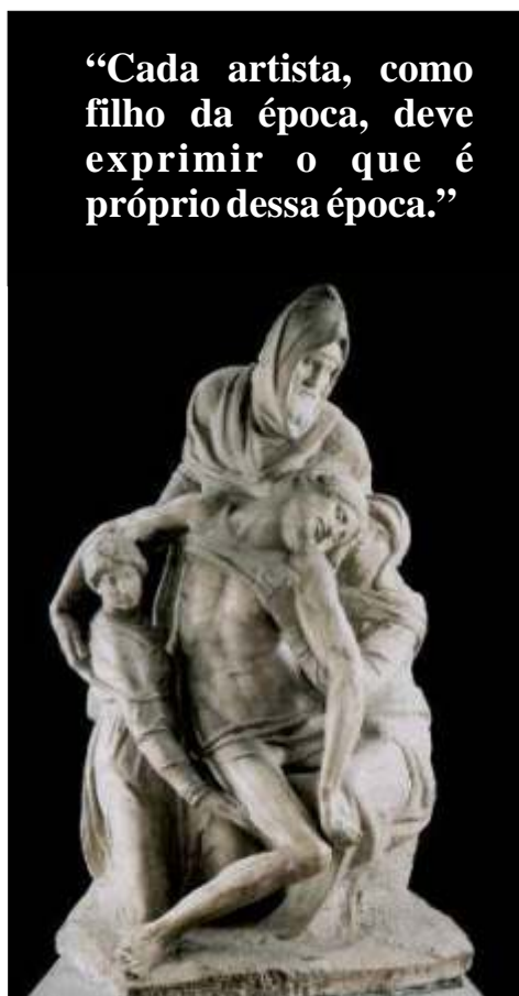
Piedade, de Michelangelo, Museu da Catedral, em Florença, Italia, séc.XV

caracterizado por sucessões contínuas de rupturas, algumas estilísticas intencionais, outras consideradas obrigatórias, a Arte vive variações de intensidade dependendo da sua época: Primitiva, Gótica, Renascentista, Barroca, Romântica, Impressionista, Expressionista, Abstracionista, Surrealista, Concre-tista, Neoconcretista, Figurativa, Vanguardista, configurações da arte que evidenciam os ritmos do SER no seu eterno devir.