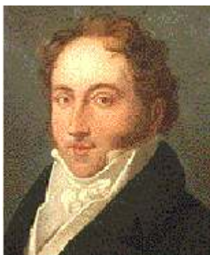
Gioacchino Antônio Rossini (1792-1868) O Barbeiro de Sevilha é sua obra mais famosa.

No capítulo 45, daquela mesma obra, o autor espiritual discorre sobre as atividades no “Campo da Música”, aprazível localidade destinada aos mais interessantes exercícios musicais, onde, inclusive, teve a grata oportunidade de maravilhar-se com um belíssimo hino, cantado por duas mil vozes simultâneas.