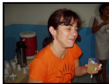
Olha a nossa tenente, que alegria! exercendo a faculdade mediúnica da psicografia.