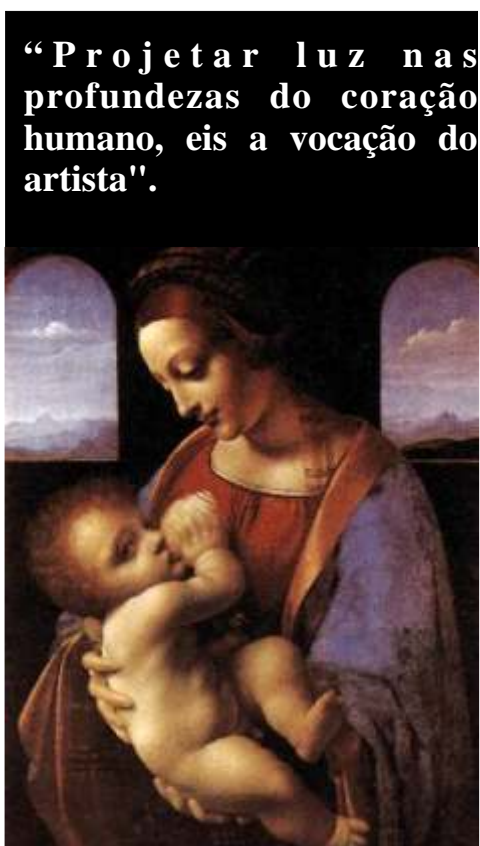
“Projetar luz nas profundezas do coração humano, eis a vocação do artista”. A virgem e o Menino, Leonardo da Vinci Museu do Hermitage, séc. XVI

Tampouco é questão de originalidade ou inventividade. É algo muito maior, abrangente, uma vez que requer uma entrega total e incondicional da pessoa (do SER artista) ao modo de ser das matérias com as quais lida, uma identificação intuitiva, pensar filtrado pela afetividade. Requer uma relação dialógica artista X matéria, através da qual se efetiva um intenso engajamento que envolve a totalidade do consciente e inconsciente, o ser intelectual e o emocional, o sensual e o espiritual.