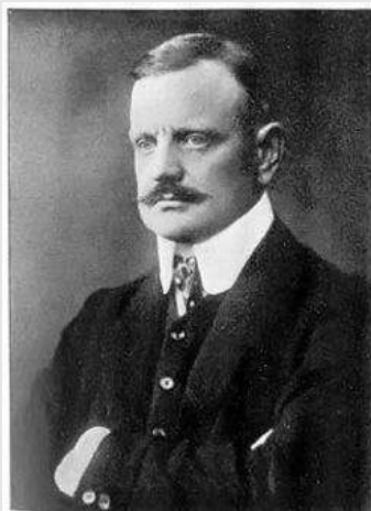
Jean Julius Christian Sibélius 1865 -1957 Finlândia